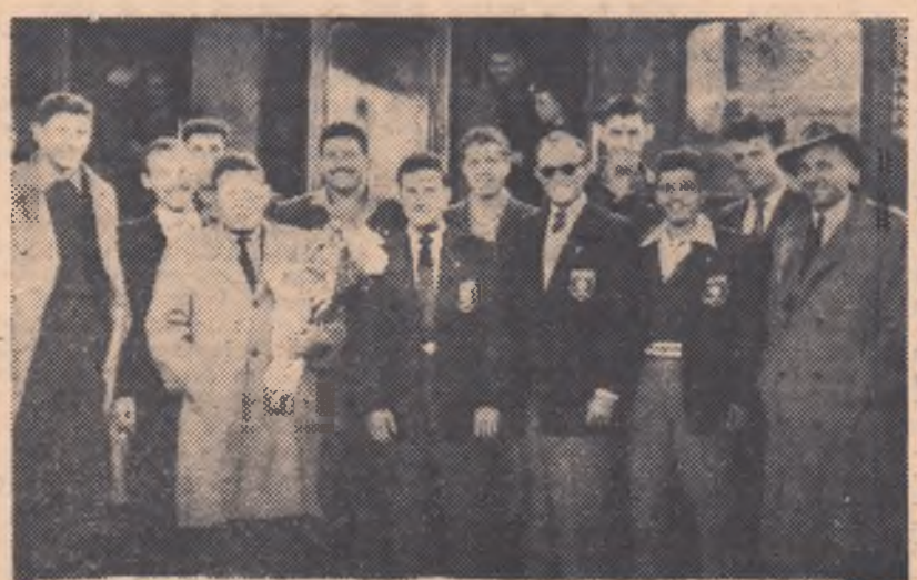
Echipa Macabi Tel-Aviv, fotografată la sosirea în Gara de Nord

• Vörös Meteor la București. La începutul lunii mai sînt asteptate să sosească la București inotătorii și jucătorii de polo de la Vörös Meteor Budapesta. Sportivii maghiari vor întîlni între 2—10 mai în meci revanșă, pe inotătorii colectivului Progresul Gospodârji.