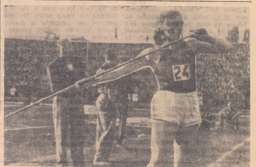
O imagine din nou actuală, după 7 ani... Galina Zibina, fotografată aici cu prilejul campionatelor noastre internaționale din 1951, se anunță una din principalele preferențe ale titlului la aruncarea sulitei, la Campionatele europene de la Stockholm.

Pe echipe a cîștigat R.P. Ungară cu 79h 44'25", echipa iugoslavă avînd timpul de 81h 37'13". (Agerpres).