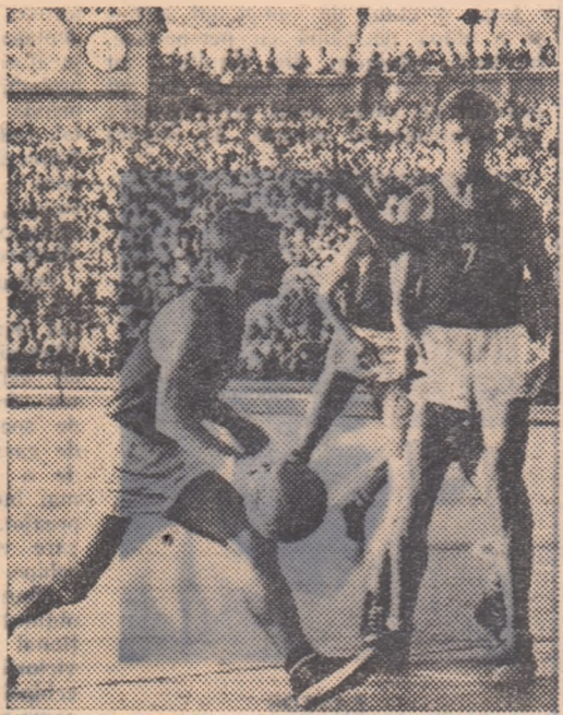
STONKUS, unul dintre cei mai experimentați jucători sovietici, în plină acțiune. Alături de el, Zubkov, o speranță a baschetului din U.R.S.S.

Peste două zile, în uriașă sală a Palatului Sporturilor de la Moscova, arbitrii Blanchard (Franța) și Ferencz (România) vor anunța începutul celei mai interesante confruntări baschetbalistice actuale: meciul dintre reprezentativele masculine și feminine ale U.R.S.S. și S.U.A. Cercurile sportive din întreaga lume privesc cu toată atenția meciurile din capitala Uniunii Sovietice, ca manifestări de o deosebită importanță pentru baschet și, mai ales, ca o contribuție la întărirea legăturilor de prietenie dintre sportivii sovietici și cei americani.