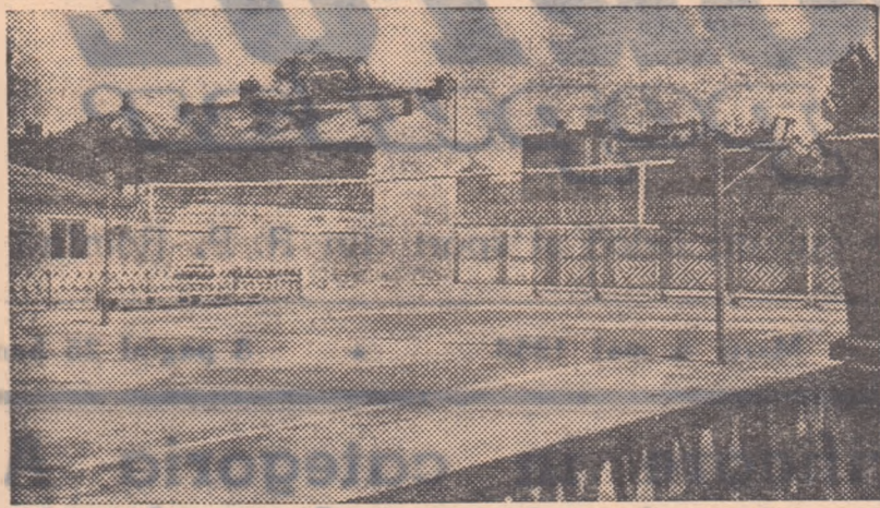
Așa arată baza sportivă a clubului sportiv „Progresul Muncii” din str. Cezar Boliac nr. 7—9, una dintre cele mai frumoase baze sportive din raionul Tudor Vladimirescu.