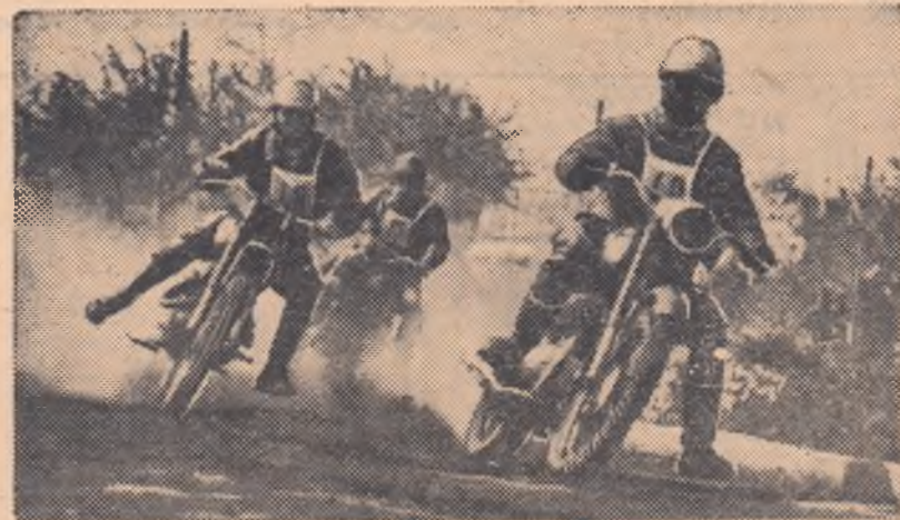
În plină viteză alergătorii atacă turanta.