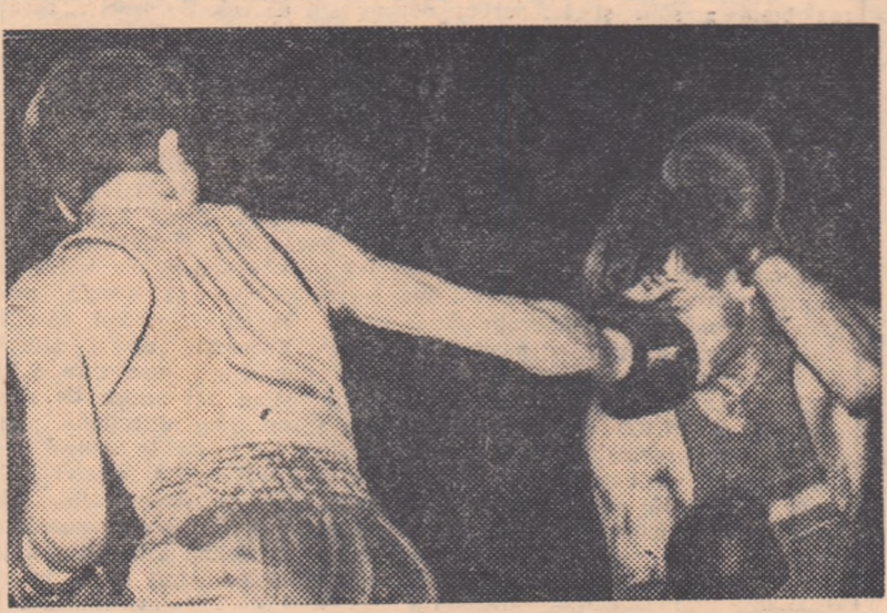
Cîte asemenea lăze pline de dinamism nu ne vor oferi finalele din acest an ale campionatelor republicane individuale de box!