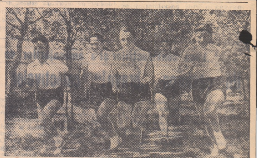
Pe una din frumoasele alei din curtea Școlii profesionale electrotehnice din Capitală, un grup de elevi se antrenează pentru o probă foarte îndrăgită: crosul.

ceput de sezon sau... în preajma unor competiții deosebite. Activiștii sportivi trebuie să solicite în mai mare măsură sprijinul conducătorilor de întreprindere, conducătorilor organizațiilor de masă, tineretului sportiv, în scopul asigurării întinerii terenurilor și a micilor reparații prin resurse locale, muncă voluntară, în general prin acțiuni necostisitoare, dar eficiente. Pentru ca să nu se ajungă însă la reparații și reamenajări de mare amploare, necesitînd fonduri, contracte cu întreprinderi de specialitate și alte „amănunte” care pot amîna uneori cu luni redarea în funcțiune a unei baze sportive, este necesară multă operativitate. Deseori o spîrtură în plasa de sîrmă care înconjoară terenul sau alte mici deteriorări foarte lesne reparabile dar... nereparate la timp ajung să provoace, prin lărgirea lor, pagube importante fondurilor colectivului sportiv.