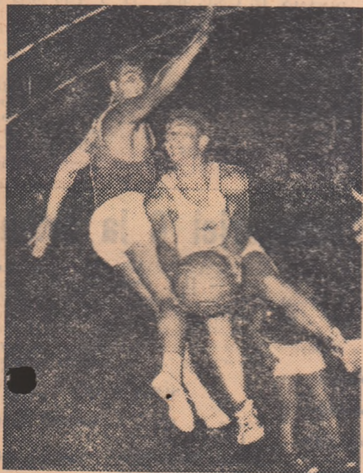
Folbert a pătruns pe lângă Stoimenov și aruncat la coș