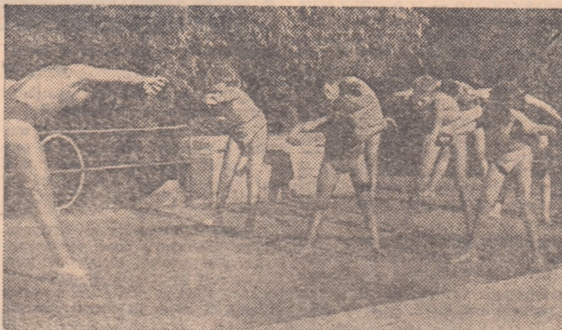
Prima lecție de înot se face pe... uscat. Dar pionierii pe care-i vedeți în dișeau nostru se vor acinta curînd în apa limpede a frumosului lor bazin.