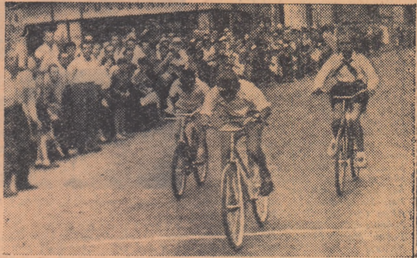
Sosire strînsă într-una din probele de biciclete „jumătate”