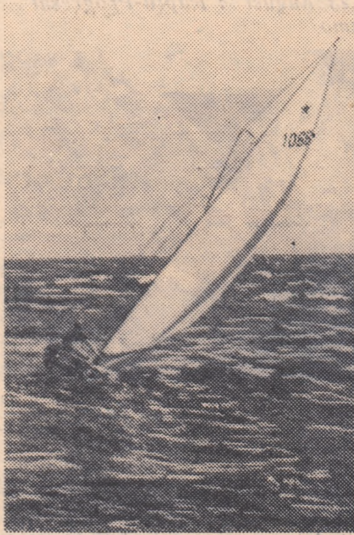
Concursul internațional de iahting programează — pentru prima dată — și o întrecere de slar.