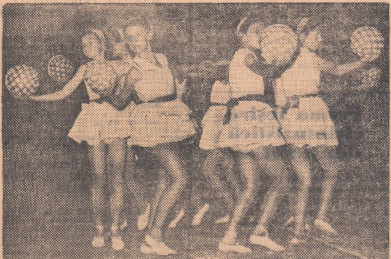
Exercițiul cu mingi prezentat de elevele școlii elementare nr. 179.