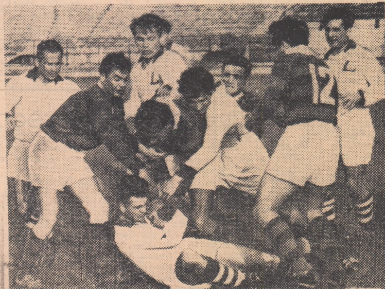
Fază din întîlnirea de rugbi C.C.A. — C.F.R. Grivița Roșie din semifinalea Cupei R.P.R.