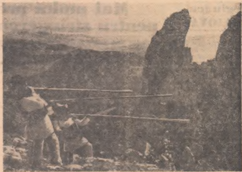
Anul trecut în luna iulie, echipa de buciurmasi de la Sindicatul C.F.R. Cimpulung-Est (Moldovenesc) și-a ales ca loc de repetiție pitoreștile Pietre ale Doamnei din Rarău, regiunea Suceava.