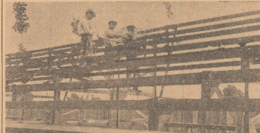
Mai sînt, desigur, multe de făcut dar ritmul lucrărilor ne arată că acestea vor fi terminate la timp.

Cunoscînd deficiența arătată de Hoțărîrea partidului și guvernului din 2 iulie 1957 că nu sînt folosite din plin „resursele locale pentru construirea și amenajarea de noi baze sportive”, un colectiv inimos, sprijinit larg de conducerea întreprinderii, a trecut la construirea unui stadion cu 10.000 de locuri chiar în curtea întreprinderii. Stadionul urmează să aibă o pistă de atletism cu șapte culoare, terenuri și gropi pentru sărituri și aruncări, un teren de baschet și unul de volei.