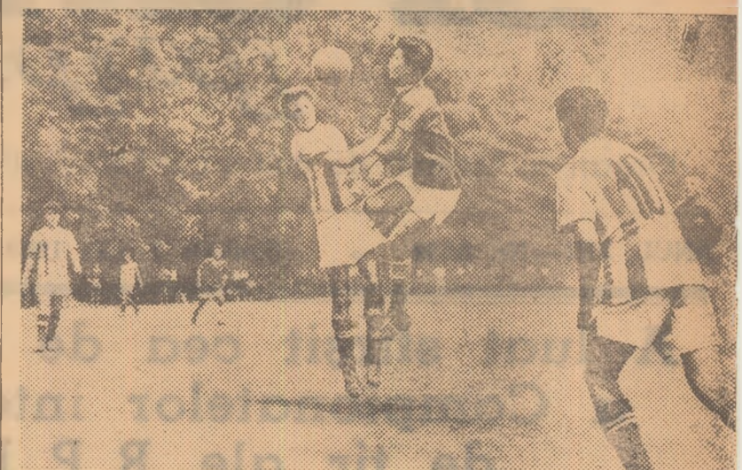
În prima zi de întreceri din cadrul finalei pe țară a campionatelor școlilor profesionale, una din cele mai disputate partide a fost cea de fotbal care a pus față în față echipele reprezentative ale Ministerului Transporturilor și Min. Ind. Chimiei și Petrolului. Fotografia noastră reprezintă o fază din acest meci.