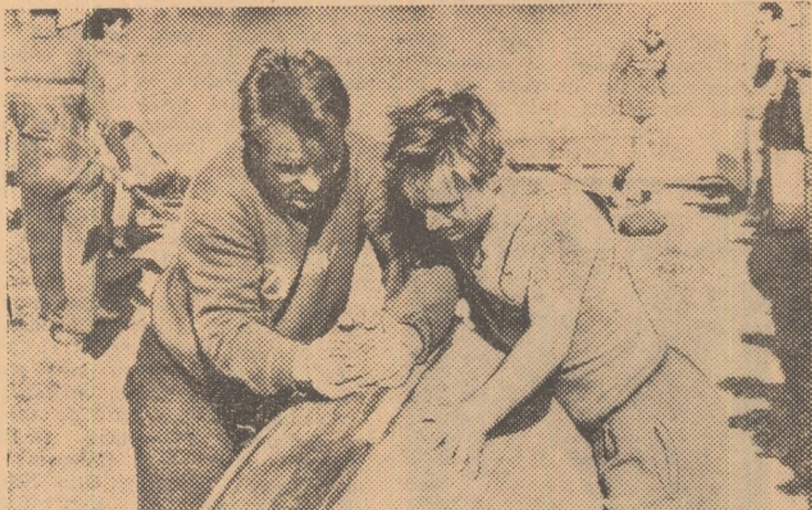
Înainte de începerea concursului, campionii olimpici Simion Ismailciuc și Dumitru Alexe își pregătesc barca cu multă grijă.