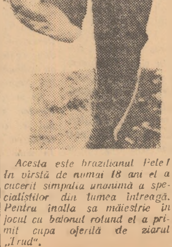
Acesta este brazilianul Pele! În vîrstă de numai 18 ani el a cucerit simpatia unanimă a specialiștilor din lumea întreagă. Pentru înalta sa măiestrie în jocul cu balonul rotund el a primit cupa oșerilor de ziarul „Lud”.

natul mondial, dar suedezi se mîndresc și ei (parțial) cu acest titlu. Ziarul „Stockholm Tidningen” a dat următorul titlu: „Suedia a fost campioană mondială... dar numai 4 minute” (n.n. Suedia a deschis scorul prin Liedholm conducînd cu 1—0 doar... patru minute). ● În ce privește numărul spectatorilor, actuala ediție a C.M. a dat un adevărat fallment. De pildă la meciul Țara Galilor — Ungaria au fost vîndute doar 4800 bilete! ● Stabile, antrenorul echipei Argentinei, s-a supărat! Ieșind cu prestigiul șifonat din acest campionat, el a anulat toate contractele cu privire la turneul din Europa revenind în țară a doua zi după înfrîngerea cu Iugoslavia (6—1).