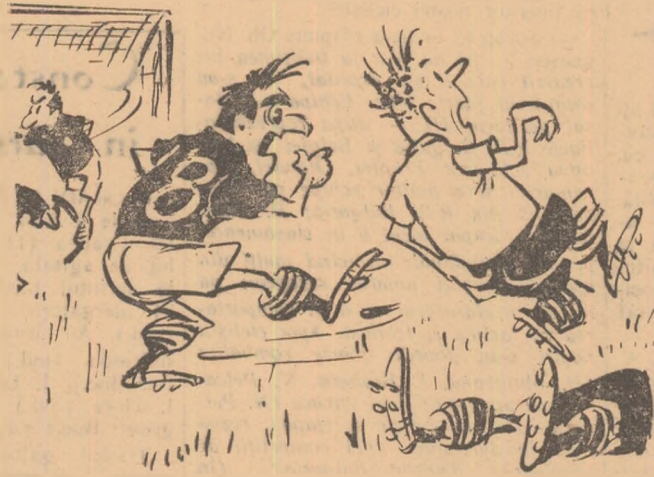
— Asta fiindcă ne-ai scos vorba că jucăm brutal!!

Prin desenul de mai sus, colaboratorul nostru MATTY și-a spus, în felul său, părerea despre jucătorii de fotbal care se preocupă mai puțin de mingea și mai mult de... picioarele adversarilor.