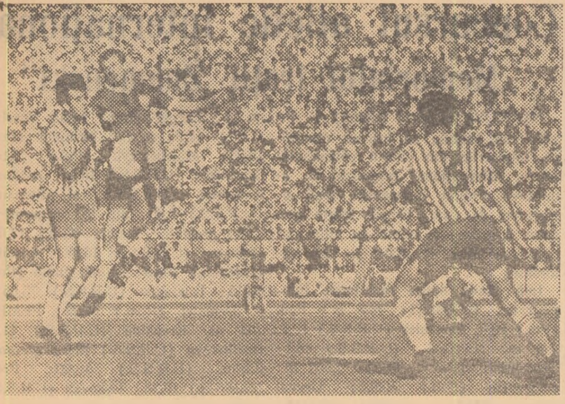
Știrbei (stînga) și Cădariu (drea pia) în luptă pentru balon, în mod corect și spectaculos. Caricaș (nr. 3) este gata să intervină.