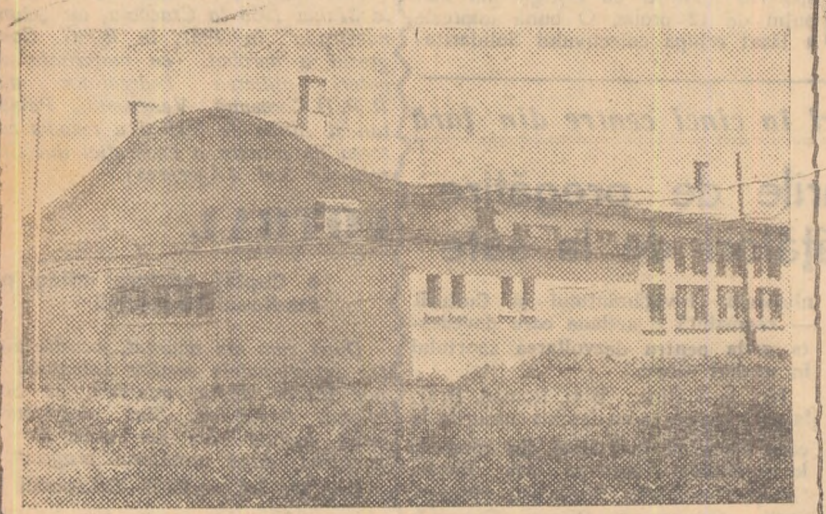
Sala de sport din Roman este aproape terminată. Păcat numai că grațioasele curbe ale acoperișului rețin apa, iar repararea acestei preseli de construcție va cere noi cheltuieli.

osebită gravitate, care trebuie reamintite prezentate ca un exemplu de cum NU trebuie să se construiască. Povestea stadionului „23 August” din Bacău începe cu câțiva ani în urmă cînd, pe plan local, s-a pornit construirea unui teren de fotbal. Dar