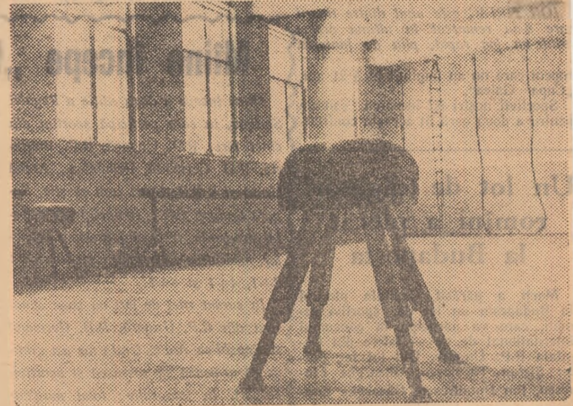
Așa arată sala de gimnastică a școlii elementare mixte Nr. 50, construită în primul semestru al acestui an, cu sprijinul Sfatului popular al raionului 23 August.