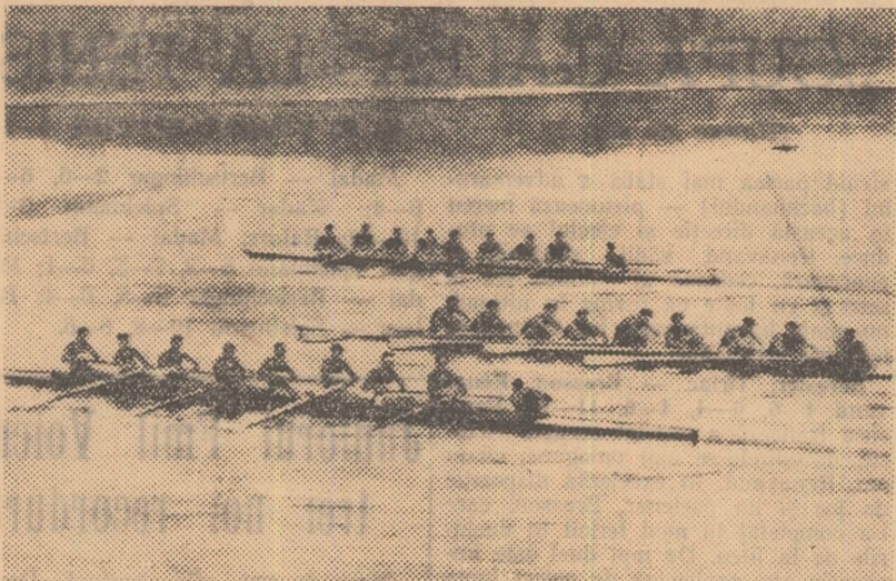
Aspect din finalul probei de recușificare la 8 + 1.

De puține ori am asistat pe lacul Snagov la un concurs atât de reușit ca cea de a doua ediție a „Regatei Snagov“, încheiată ieri. Participarea valoroasă, echilibrul întrecerilor, marele număr de spectatori (prezenți atât în tribunele de la „malul tăiat“, cât și în zeci și zeci de ambarcațiuni de tot felul care au roit tot timpul pe marginea pistei), o vreme admirabilă, toate aceste elemente au creat o atmosferă corespunzătoare unui mare concurs internațional.