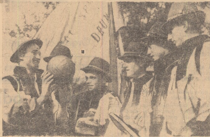
Cîtă voie bună și satisfacție pe fețele tinerilor colectivisti din comuna Marginea, raionul Rădăuți! Au și de cel De curînd, echipa de volei a colectivului sportiv sîtesc „Drum Nou” a fost declarată campioană raională.