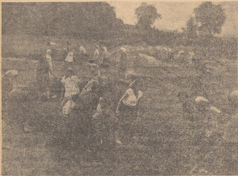
Harnicele muncitoare de la „Țesătura”-Iași lucrează la amenajarea lacului pentru canotaj.