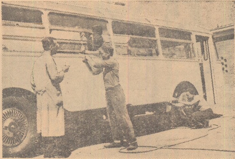
O ultimă verificare minuțioasă a mașinii și în curând noul troleibuz „Tudor Vladimirescu” va porni în rodaj.