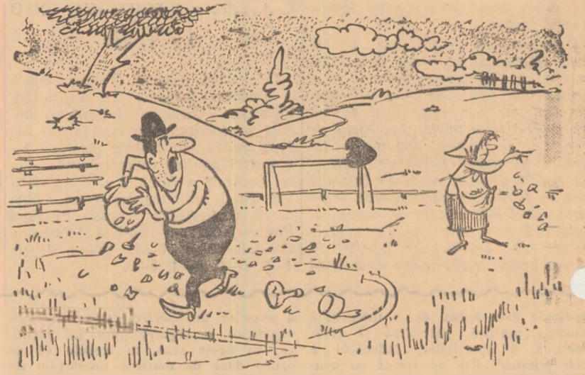
— Vino mai pe la centru Gherghino! N-ai văzut că ei nu joacă de loc extremele?!..

Pentru confirmarea categoriei se cere ca în unul din cei doi ani următori obținerii normei sportivul să repete integral norma.