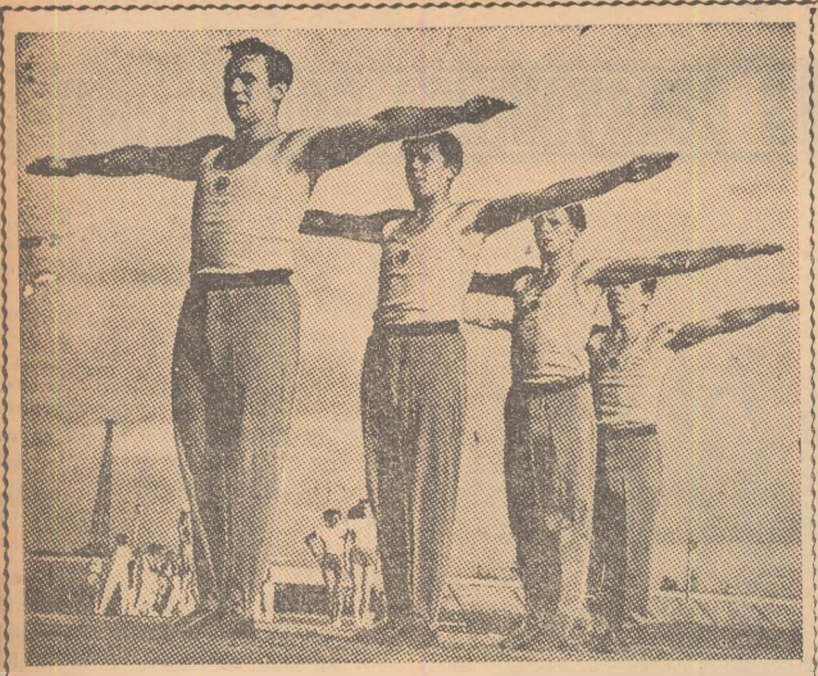
Organizația sportivă „Sokol” reunește zeci de mii de tineri iubitori de sport din satele R. Cehoslovacie. Iată un grup de sokoli pregătindu-se pentru exercițiile de gimnastică din cadrul viitoarei Spartachiade