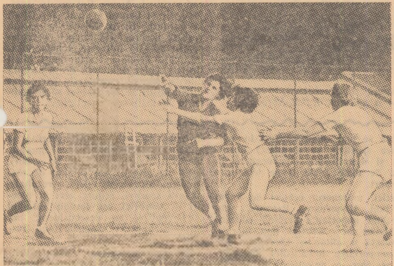
Fază din jocul dintre echipele feminine I.T.B. București și „Spic” Căzănești, disputat la București în cadrul etapei interregionale.