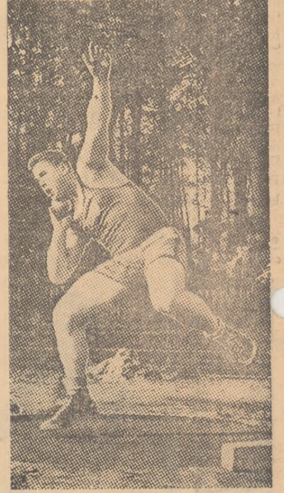
Iuri Skobta (Cehoslovacia), campion european în 1954, este principalul favorit și la întrecerile din acest an.