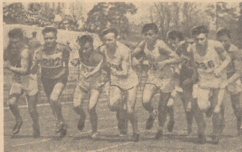
Oare cîți tineri, asemenea celor din fotografia noastră, nu așteaptă cu bucurie să ia stăruie la întrecerile de masă?