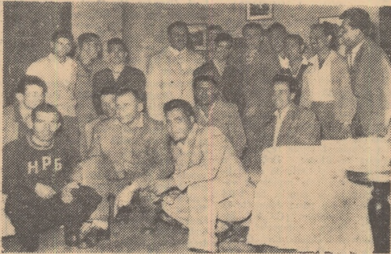
Oaspeții bulgari au deplasat la București un lot numeros de sportivi. Iată o parte dintre luptătorii care vor evolua astăzi.

Întrecerile încep astăzi la sala Floreasca