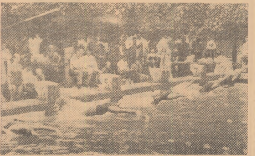
Start în proba de 100 m. spate fete.

★ Clasamentul general pe regiuni al campionatului republican școlar de natație ediția 1958 se prezintă astfel: 1. București 268 p.; 2. Cluj 221 p.; 3. Timișoara 218 p.; 4. Reg. Stalin 152 p.; 5. Clubul școlar Iureș București 142 p.; 6. Regiunea Autonomă Maghiară 134 p.; 7. Galaji 102 p.; 8. Ploști 88 p.; 9. Oradea 84 p.; 10. Bacău 11 p.; 11. Iași 7 p.