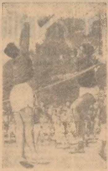
Pentru tinerii din fotografie (și nu numai pentru ei) o astfel de întrecere nu poate fi o competiție... mică.

Începutul campionatelor raionale și regionale înseamnă o puternică înviore a activității sportive generale în mediul sătesc. În aceste campionate se întrec nenumărate echipe sau loturi de sportivi de la sate care croiesc astfel sportului de performanță drum către satele noastre. Nici aici exemplele nu trebuie căutate prea mult. Sînt cunoscuți în întreaga țară jucătorii de omă de la Curcani, atletii din Recas, handbaliștii de la Hălchiu sau Periam, volebaliștii din Belean sau luptătorii din satele conștanțene. O dată cu începerea campionatelor, vom fi desigur martori la mii și mii de „debuturi” în echipele raionale și regionale. Este, credem, unul să mai spunem cît de mult stimulează acest lucru activitatea colectivelor. Dar, „startul” în campionate raionale și regionale reamintește activiștilor sportivi sarcini importante legate de desfășurarea acestor întreceri. Nu mai pot fi admise cazuri ca acela al colectivului din com. Negoști (reg. București) care plătea salarii jucătorilor de fotbal, iar aceștia stăteau foarte frumos în... București. Trebuie, de asemenea, întărită munca educativă.