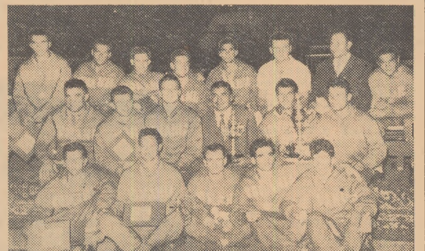
Echipele de lupte clasice și libere ale R. P. Romîne în rîndul cărora se află cei șase campioni balcanici.