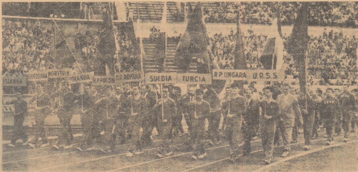
Aspect de la festivitatea de deschidere a întrecerilor din cadrul celei de a XI-a ediții a campionatelor internaționale de atletism.

C a în fiecare toamnă, decor multicolor și atmosferă sărbătorească pe Stadionul Republicii... Ca la fiecare festivitate de deschidere, chemare sonoră de trompete, pluton masiv de steaguri înfrățindu-și undușor culorile în adierea vântului... Ca la toate dezlănțuite de până acum, ropote nesfârșite de aplauze salutând apariția fiecărei delegații... De astă dată, pășesc pe gazonul stadionului atleți din 20 de țări. Ei