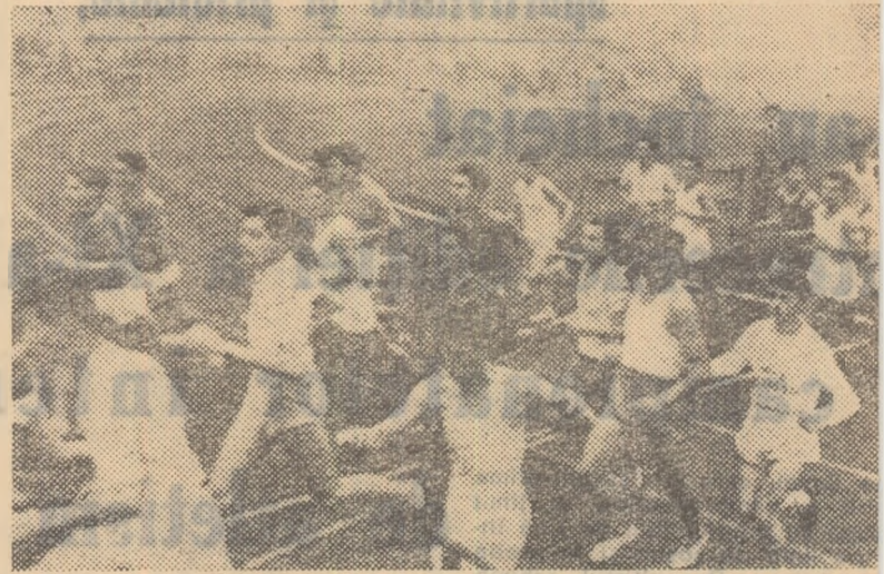
Nenumărate sînt colectivele sportive în care au început pregătirile pentru organizarea întrecerilor de cros. Nu peste multă vreme prin parcurile orașelor, prin păduri și pe alei, mii și mii de tineri își vor disputa cu entuziasm întîlnirea la cros!