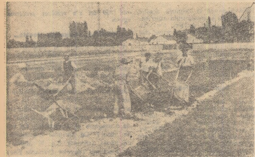
La Institutul Pasteur se lucrează de zor. Frumoasa bază sportivă cu care va fi dotat colectivul sportiv al Institutului va putea să găzduiască în curînd numeroase întreceri sportive.

fotbal, a terenurilor de volei, baschet și tenis și a poligonului de tir, într-o serie de sectoare de producție ale uzinei s-a muncit voluntar la confecționarea pieselor metalice și lemnoase necesare. În aceste condiții, baza sportivă poate fi azi folosită pentru activitatea sportivă de masă, antrenamente și meciuri oficiale, iar finisarea ei continuă, tot prin muncă voluntară.