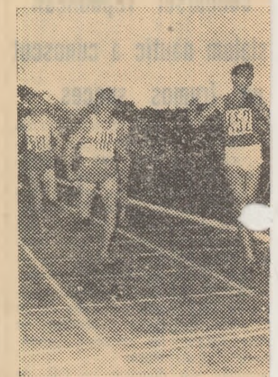
György Kiss învingător la 1500

1. IOLANDA BALAS (R. P. R.) 1,78 m.; 2. N. Zwier (Olan- da) 1,64 m.; 3. Cen Fen-ün (Ch- ineză) 1,64 m.; 4. I. Söderl- (Suedia) 1,60 m.; 5. R. Knapp (A- tria) 1,60 m.; 6. I. Kilian (R.F.) 1,60 m.; 7. J. Jozwiakowska (R.P.) 1,50 m.; 8. R. Voroneanu (R.P. jun.) 1,50 m.