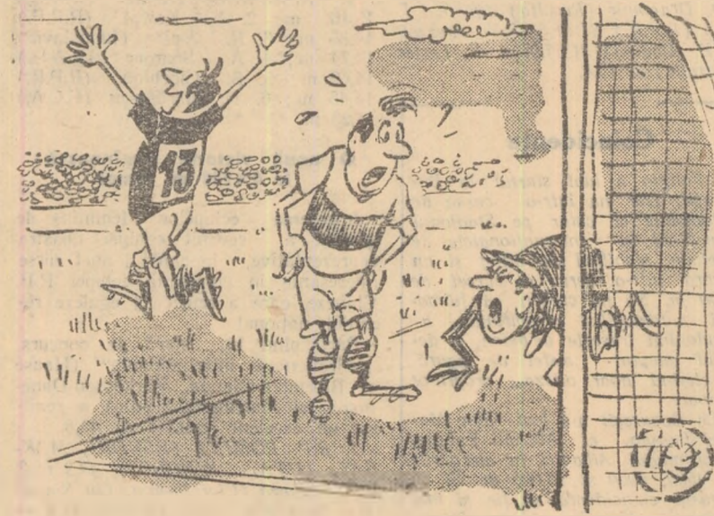
— Bine, omule, în loc să-l blochezi, stai în față și sculpi în sintă! — Păi... știam eu că asta care a intrat acum o să fie cu ghinion!!

grădini zoologice. Ei „uită” să adauge însă că Battling Siki, victimă tipică a profesionalismului, căzuse în patina beției, devenind alcoolic în ultimul grad. S-ar mai putea da și alte exemple. Un portar argentinian de fotbal, își deservise pe tricou o poartă de fotbal, convins că astfel va atrage șturile atacanților adversi spre... pieptul său. Este inexplicabil cum un șahist genial ca Alehin, care a dezvoltat ca nimeni altul teoria șahistă, a putut să recurgă în decursul activității sale la tot soiul de talismane (de pildă, el nu se despărțea niciodată de... pisica sa, care trebuia să stea în sală când Alehin juca). Oricite pisici „miraculoase” ar fi purtat cu sine Alehin, este neîndoios