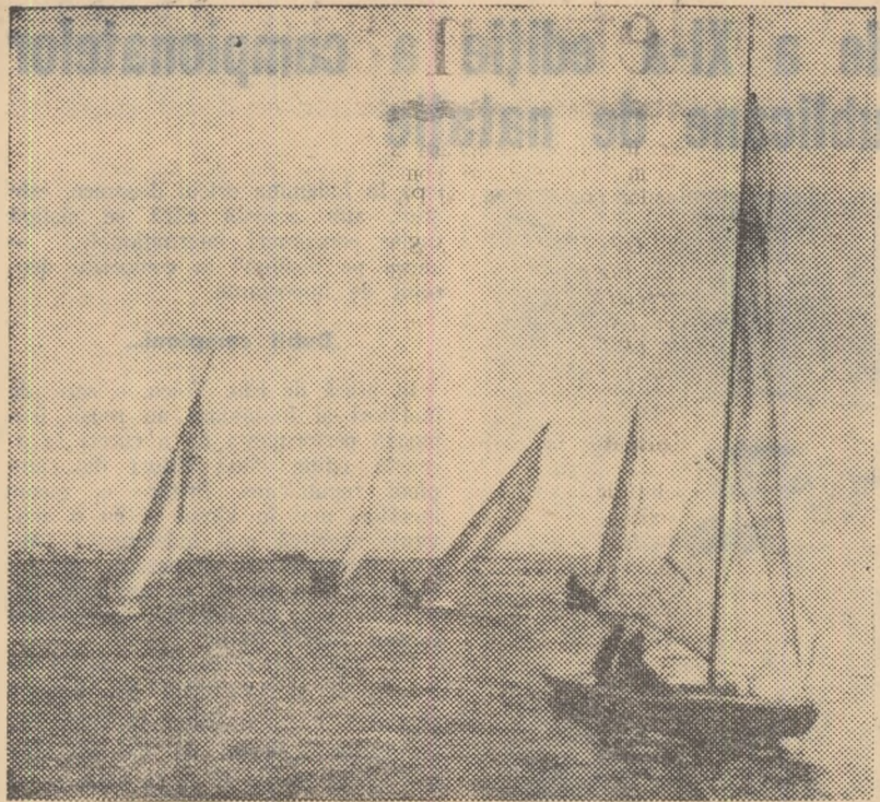
Echipajele de star își vor disputa din nou întâietatea, începând de mâine, pe mare, în fața portului Constanța.