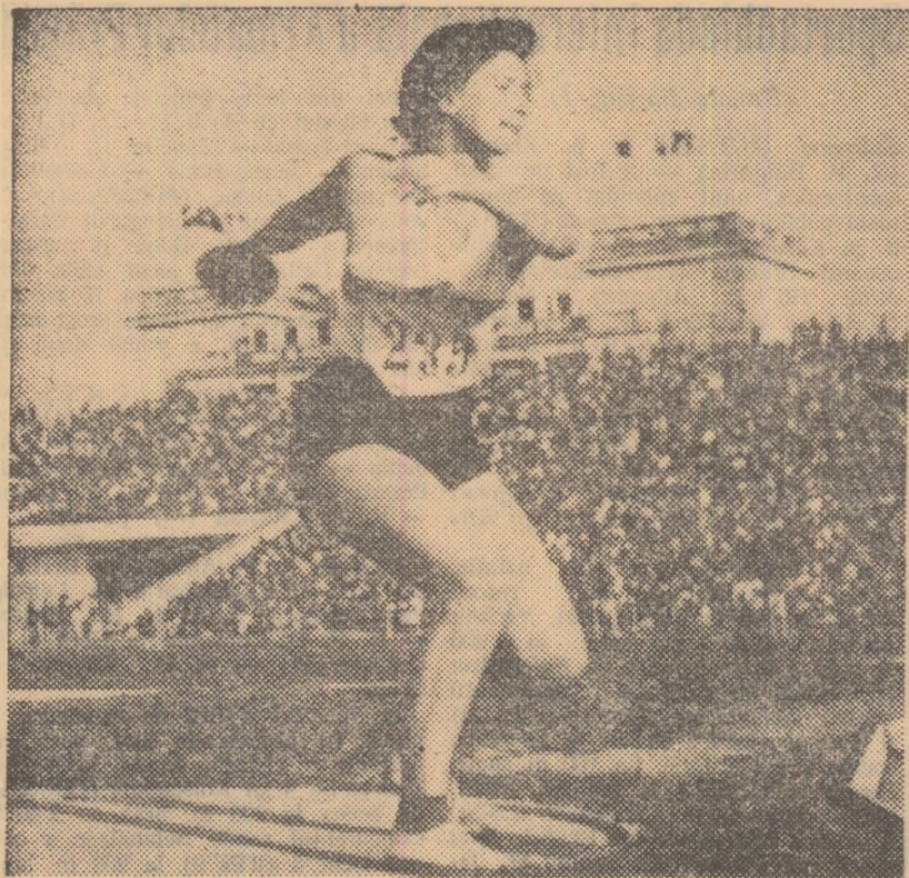
Maestra sportului Lia Manoliu pregătindu-se pentru aruncarea care avea să-i aducă titlul de campioană balcanică.