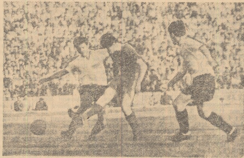
Constantin (C.C.A.) și-a făcut loc printre Neacșu și Pahonțu (Petrolul) și a tras la poartă.

În primele 25 minute inițiativa a aparținut textiliștilor, care au atacat mai mult și au beneficiat de două lovituri de colț, nefructificate însă. În plină dominare a arădenilor, Dinamo înscrie. În min. 28, Suru centrează la Szakaes I, acesta reia slab cu capul spre poartă și mingea ar fi ieșit afară pe lângă poartă dacă Coman nu ar fi sărit... foarte spectaculos, scăpând însă mingea din mână. Bükössi, atent, a reluat în poartă goală: 1-0 pentru Dinamo. În min. 51 Szohar este faultat în careu de către Motroc dar arbitrul nu sancționează infracțiunea. Un minut mai târziu, Szohar îi pasează lui Jurec, iar acesta dintr-o poziție dificilă reia în colțul opus, aducând egalarea: 1-1. Golul victoriei este înscris în min. 58. După o lovitură de colț executată de