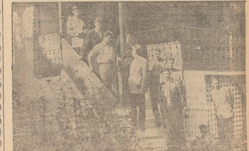
Înainte antrenamentului de ieri dîmîneață, jucătorii echipei de baschet Dinamo Moscova — care va susține un interesant turneu în Capitală și la Tg. Mureș — au vizitat „Muzeul Satului”. (Citiți amănunte în pag. a IV-a)