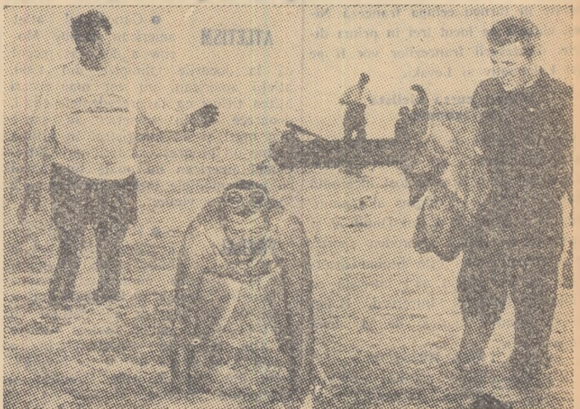
Iată cum a terminat Greta Andersen traversarea Canalului Minecii. Complet epuizată, ea nu se mai poate ridica în picioare, fiind nevoită să se trască lamentabil pe ultimii metri.