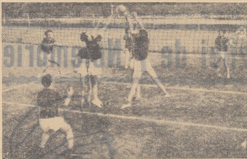
Competițiile de casă se bucură de o mare popularitate în colectivul „Centrocoop”. Iată un aspect de la un campionat de casă desfășurat anul trecut.

Sînt cîteva din cele mai înbucurătoare constatări pe care și le prilejuiește o vizită la colectivul sportiv „Centrocoop” din Capitală.