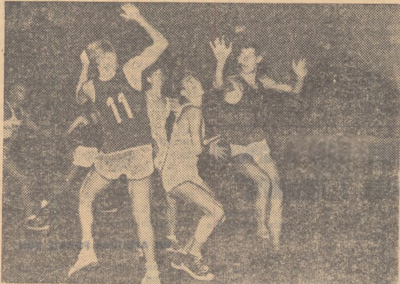
Bile (Olimpia) i-a fentat pe Călugăreanu și Cucos (Rapid) și astfel va putea pasa mingea coechipierilor săi.

C.S. Victoria: Degen, Zlurian, Comănescu, Catană, Dulimov II, Zgricea, Baghilovici, Stanca (Pășcălu), Secășanu, Neacsu (Berbecaru).