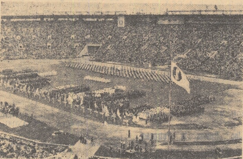
Un moment emoționant pe marele stadion „V. I. Lenin” din capitala Uniunii Sovietice: solemnitatea de deschidere a Jocurilor Sportive din cadrul Festivalului de la Moscova.