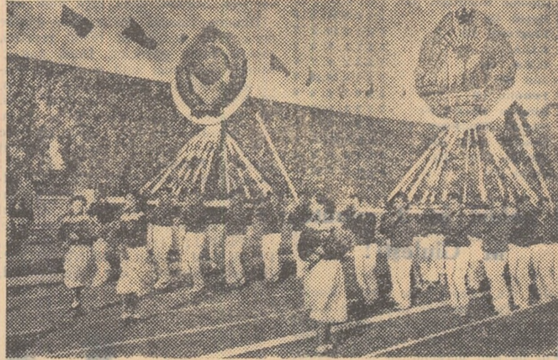
Purtate pe umeri tineri Stejerele de Stat ale U.R.S.S. și R.P.R. pășesc alături în fruntea coloanelor de sportivi, simbol al frăției dintre cele două popoare, prietene pe veci.

Crearea lagărului socialist, crearea unei vaste zone a păcii — iată izbînz