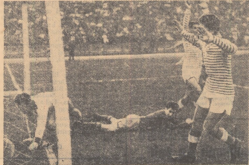
U.T.A. a marcat al doilea gol în meciul cu Progresul. Autor: Tîrlea. Explozie de bucurie la arădeni (în tricouri vărgate), decepție la bucareșteni. Dobrescu și Mîndru privesc cu tristețe balonul intrat în poartă.

Bun arbitrajul lui E. Bucșa-Sibiu. PROGRESUL: Mîndru-Dobrescu, Caricaș (Cojocaru), Cojocaru (Neagu)-Știrbei, Perel-Oaidă, Smărăndescu, Dinulescu, Neagu (Caricaș), Blujdea. U.T.A.: Coman-Sereș, Capaș, Farmati-Petschovski, Koczka-Jurcă, Igna, Tîrlea, Mețcaș, Tăucean. P. GAȚU