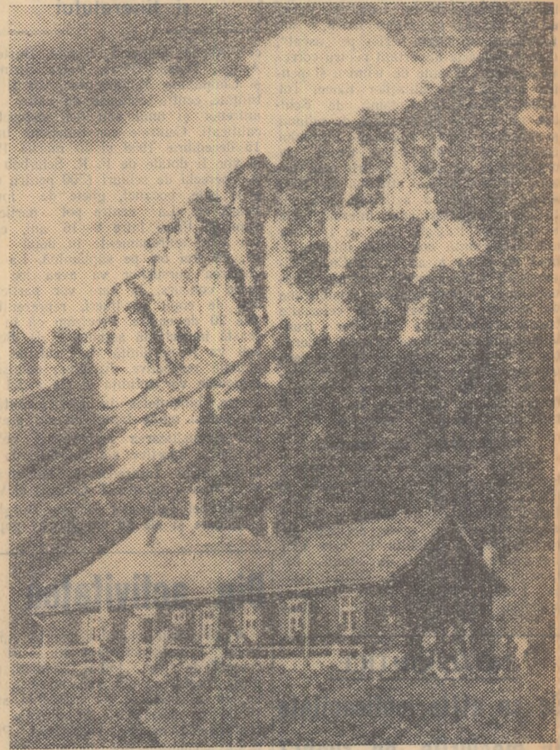
Cabana „Mălăești” așezată în valea cu același nume este foarte des vizitată de turiștii din întreaga țară. De aici pornesc numeroase poteci care urcă spre vîrfurile „Omul”, spre „Pichețul Roșu” și „Diham”.