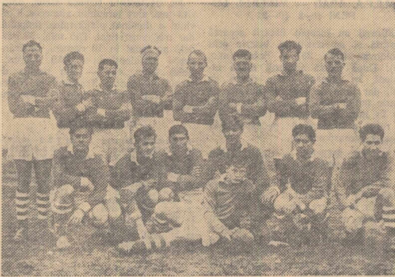
Echipe C.F.R. Grivița Roșie, campioana pe anul 1958 înaintea meciului de ieri cu Constructorul

Constructorul atacă în trombă de la început. O minge ajunsă pe aripă, la Sava, este recențată de acesta cu piciorul. Nistor o urmărește atent, și o culcă în terenul de țintă feroviar: 3—0 pentru Constructorul. (min. 5). Dominarea gazdelor este în continuare în fel de insistență și în min. 12, la un balon jucat de Buda, după un „șinț”, P. Niculescu transformă lovitura de pedeapsă: 6—0 pentru Constructorul. În min. 14, asistăm la primul atac al C.F.R. Moraru scapă singur, dar în ultimă instanță șutul său este blocat de fundașul Bărăscu. Un minut mai târziu, Gherasim reușește însă o spectaculoasă lovitură de picior căzută. Scor: 6—3. În min. 17, Moraru este scos din grămadă și recuț pe linia de treișerturi. A fost o măsură inspirată care a dat un plus de eficacitate liniei ofensive a feroviarilor. Asistăm în continuare la două lovituri de pedeapsă (foarte favorabile) ratate de Gherasim (C.F.R.) și P. Niculescu (Constr.). În acest timp (min. 23) fundașul feroviar Buda, este accidentat și părăsește pentru scurt timp terenul. Repriza ia sfârșit sub presiunea echipei campioane, care ratează de puțin prin Stanciu, două lovituri de picior căzute.