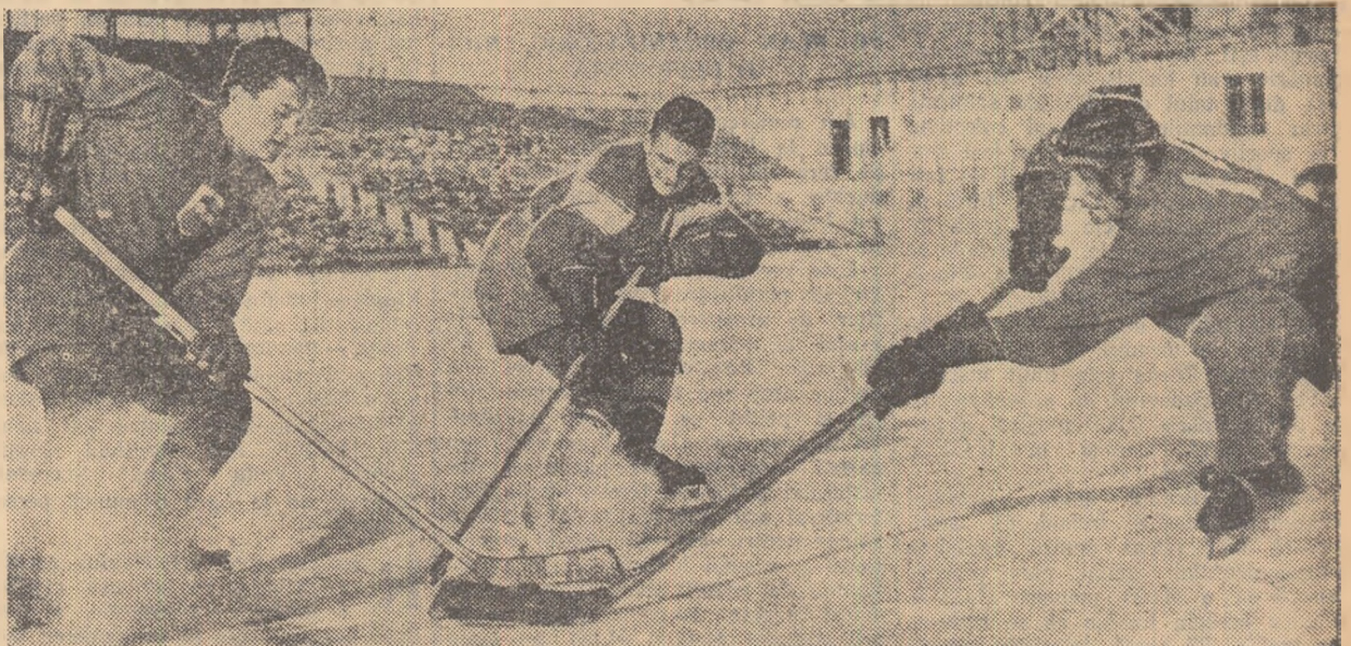
Veniți în plină viteză, cei trei hocheiști au frînat brusc în apropierea pucului. Această fază dinamică din întîlni- rea pe gheață. Începînd de mîine, patinoarul artificial din parcul „23 August“ găzduiește noi și pasionante meciuri de hochei pe gheață, ce se vor disputa în cadrul seriei a II-a a campionatului republican. (Cititi: amănunțit)