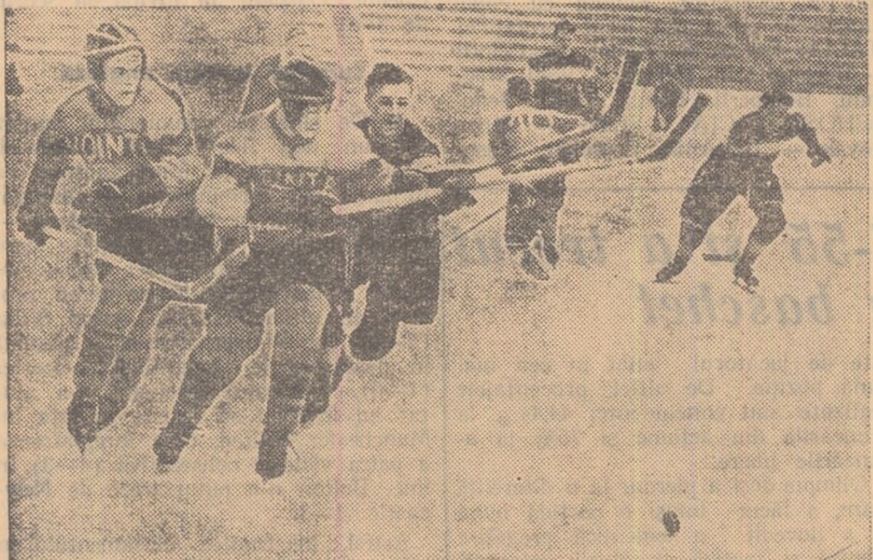
Kalamar și Andrei (Voința M. Ciuc) au ținut pe lângă Takacs II (Știința). Pericol la poarta lui Dron... Din fund Gall se repliază rapid!

Astăzi programul este următorul: ORA 10: Surianul Sebeș — Voința M. Ciuc; ORA 17: Nicovale Sighișoara — TAROM; ORA 19: Steagul roșu Or. Stalin — C.C.A.