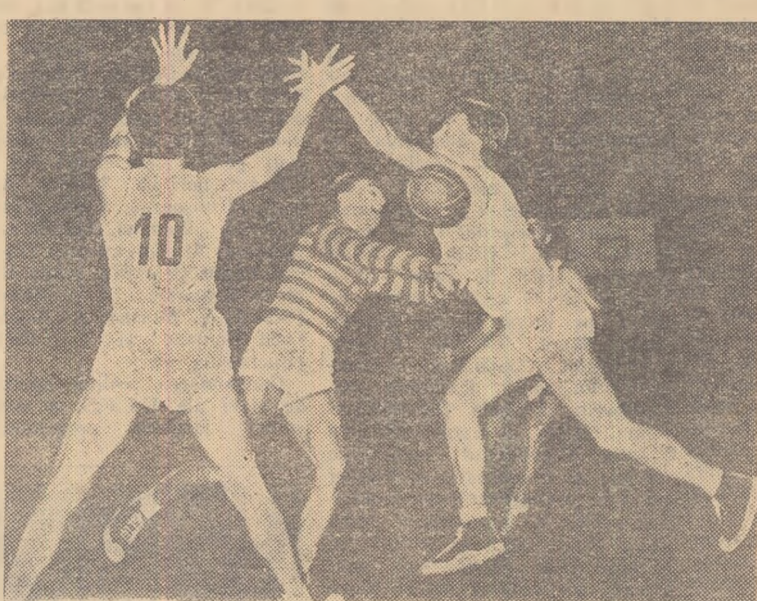
Sugestivă fază din jocul Politehnica — „Titani”

Deși nu s-au calificat pentru turneul final al campionatului republican pe 1959, jucătorii echipei C.C.A. au înregistrat și ei în ultimul timp o simțitoare creștere de formă. Se pare că ei și-au dat însă seama prea tîrziu de faptul că indiferent de locul ocupat în clasament trebuie să lupte cu toate forțele în fiecare partidă. Problema promovării în continuare a elementelor tinere rămîne o sarcină ce trebuie neapărat rezolvată.