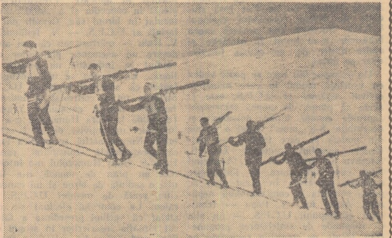
Spre culmile înzăpezite ale munților