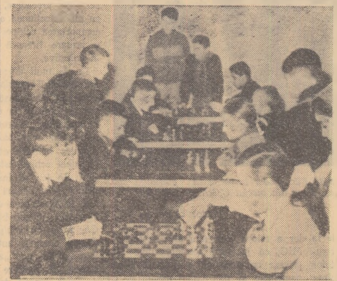
Întîlniri palpitate de șah... La fiecare mutare, trebuie să gîndești cu multă atenție... Cine va câștiga?... Premiul este ispititor: o „vală de zahăr” în orașul copiilor!