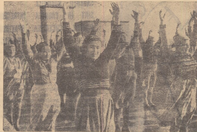
În fotografia noastră un aspect din timpul desfășurării gimnasticii de producție la cooperativa „Îmbrăcămintea” din Constanța