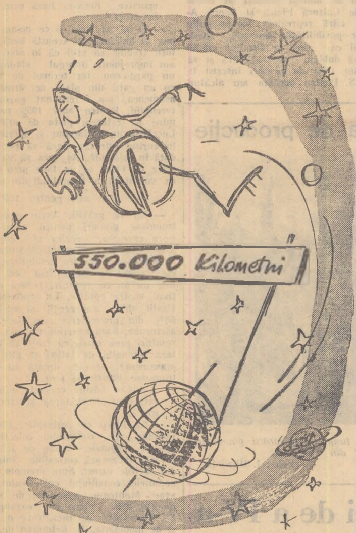
Un record greu de bătut a fost stabilit la înălțime...

După realizarea de către Uniunea Sovietică a primului satelit artificial al Pământului, lansarea, la 2 ianuarie 1959, a unei rachete cosmice sovietice care a devenit pentru totdeauna prima planetă artificială a sistemului nostru solar, constituie un eveniment memorabil al epocii de construire a comunismului și inaugurează era zborurilor interplanetare.