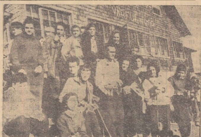
Zile de vacanță! La hotelul turistic de la Cota 1400 și cabanele Cota 1500 și Virful cu Dor, peste 300 de elevi și eleve din Capitală iau parte la tabăra organizată pentru ei de către Secțiunea de învățămînt a Capitalei împreună cu școala sportivă de elevi. Imagiunea noastră reprezintă un grup de eleve, la un popas în fața cabanei Virful cu Dor.

Perspectivile școlilor sportive de elevi ale U.C.F.S. sînt, după cum se vede, frumoase. În ce direcție trebuie depuse eforturile pentru obținerea de rezultate maxime? Se impune, mai întîi, o mai atentă muncă de control și îndrumare sub aspect tehnic din partea federațiilor și a comisiilor regionale pe ramură de sport. Se cere, de asemenea, o mai fidelă respectare a clauzelor cuprinse în contractele care au stat la baza înființării acestor școli în cadrul marilor întreprinderi. În sfîrșit, este de dorit să se pună mai mult accent pe dezvoltarea sporturilor individuale în rîndurile elevilor, pentru că în această direcție există o mai mare nevoie de cadre sportive.