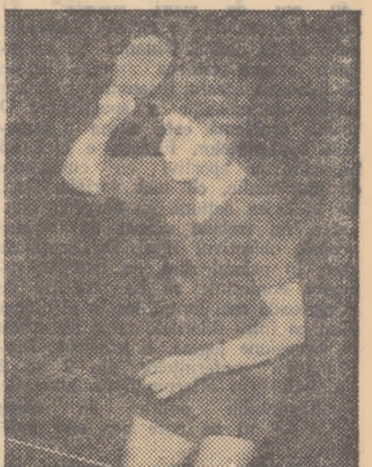
Campionul european de tenis de masă Zoltan Berczik

SIMBATA de la ora 8,30: jocuri în toate probele de dublu pînă la semi-