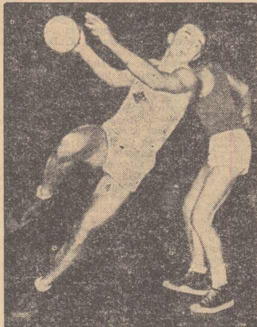
Fază din jocul Acvila-Clubul Sportiv Școlar.

C.S.U. — Rapid 5—8 (4—4); Rapid — Titanii „23 August” 26—19 (11—11).