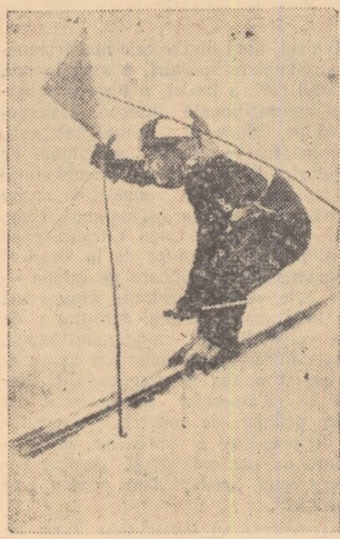
In plină cursă...

Inițiativa membrilor comisiei de schi din regiunea Ploiești constituie un frumos exemplu. Ea contribuie la popularizarea schiului în rândurile tineretului.