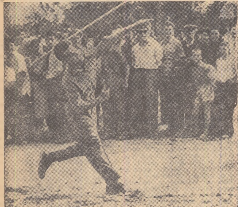
Ca și la Coteana, în comuna Domnești și în alte zeci și zeci de sate „Duminicile sportive” prilejuiesc întreceri pasionante urmărite — după cum se vede în fotografie — cu mult interes.