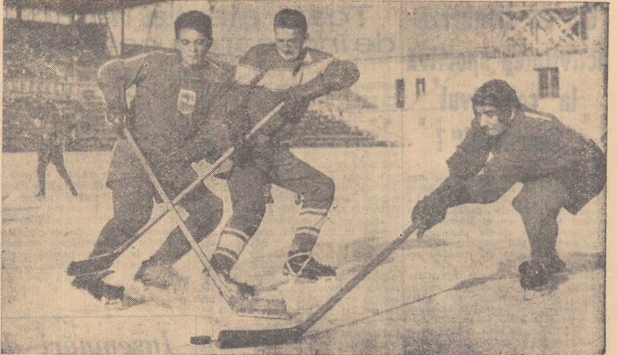
Dinamism, forță, viteză. Iată ce ne arată această fotografie prinsă cu ocazia unui meci disputat în cadrul campionatului republican pe anul 1959.

Anatorii de hochei pe gheață vor putea urmări, începînd de miine, pe patinoarul artificial din Parcul „23 August” pasionante jocuri în cadrul turului campionatului categoriei A pe anul 1959.