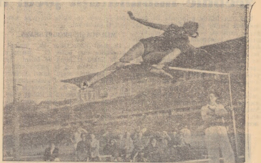
Iolanda Balaș în timpul săriturii la 1,83 m. — record mondial

Intr-adevăr, în 1958 Iolanda Balaș a avut un sezon de aur! Învingătoare la toate cele 9 concursuri internaționale la care a participat, câștigătoare indiscutabilă la campionatele europene de la Stockholm, ea a modificat de 5 ori tabela recordului lumii la săritura în înălțime, reușind cu 1,83 m cel mai valoros dintre recordurile mondiale feminine. Poate că nu este lipsit de interes să vă reamintim faptul că recordul de 1,83 m valorează 1173 p după tabela internațională feminină și este echivalent următoarelor performanțe feminine: 11,1 sec (100 m); 22,7 sec (200 m); 2:02,5 (800 m); 10,3 sec (80 m g);