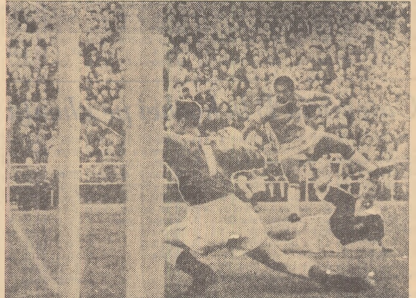
Pele (Brazilia) marchează singurul gol al meciului cu Țara Galilor. Fotbalistul brazilian a tras la poartă cu „exteriorul“ labei piciorului, înșelînd pe portarul galez Kelsey (nr. 1)

După Cupa Campionilor Europeni, care cunoaște un succes desăvîrșit, după hotărîrea federațiilor sudamericane de a organiza din 1960 Cupa Campionilor Sudamericani (pentru anul în curs s-a propus un meci campionul Europei — campionul Braziliei), iată că și înscrie numele pe lista