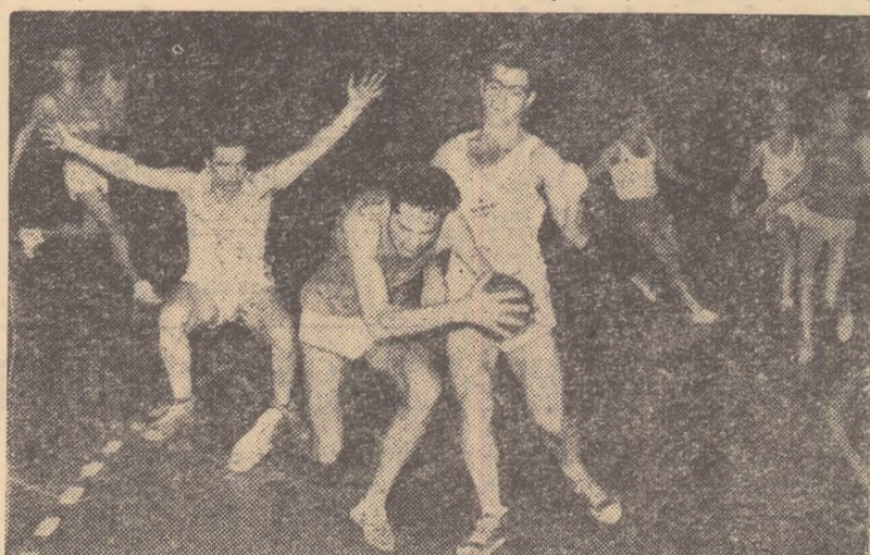
Fază din jocul Acvila-Politehnica. Apărarea echipei Acvila, surprinsă de un contraatac al studenților face față greu situației

CONSTANȚA. Nu de mult au luat sfîrșit în localitate întrecerile etapei organizate de campionatul republican de handbal în 7. Meciurile au avut loc în Palatul Sporturilor și au fost urmărite de un numeros public. După 12 etape victoria a revenit echipei Farul Constanța. Pe locurile următoare s-au clasat în ordine echipa S.N.A.C. și „Jel-fnul”. LIVIU BRUCKMER corespondent