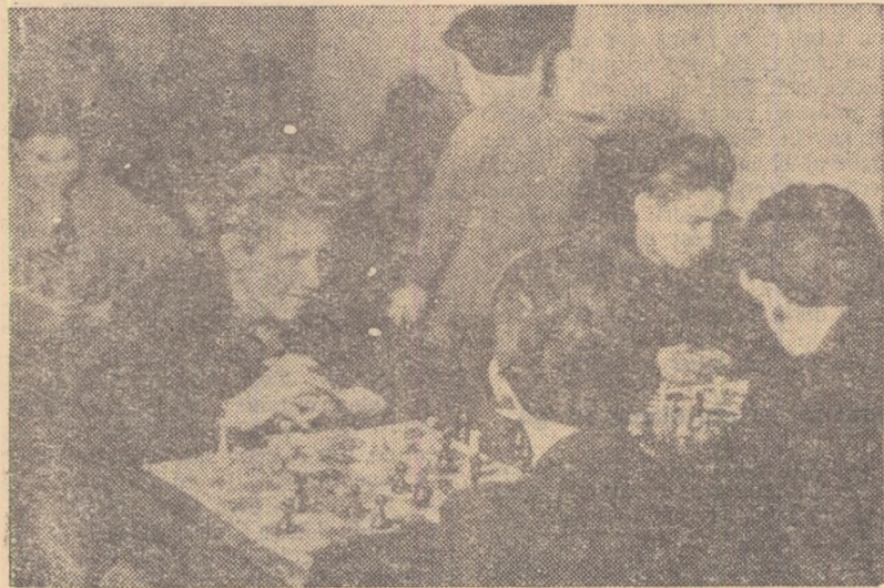
În sala de şah a clubului Constructorul numeroși tineri fac cunoștință cu acest frumos joc al minții

clubului „Constructorul” ne-au înfăpșinat glasuri vesele de copii, rîsete și exclamații. Erau micuții şahiști de la Școala medie nr. 8, veniți la antrenament în sala clubului care le sprîjină activitatea sportivă. De fapt, în apărarea zburdalnicilor elevi trebuie să spunem că îi surprinsesem „în pauză” sau — mai exact — tocmai în momentul cînd se așezau la locurile lor pentru a urmări lecția predată de antrenorul I. Silberman.