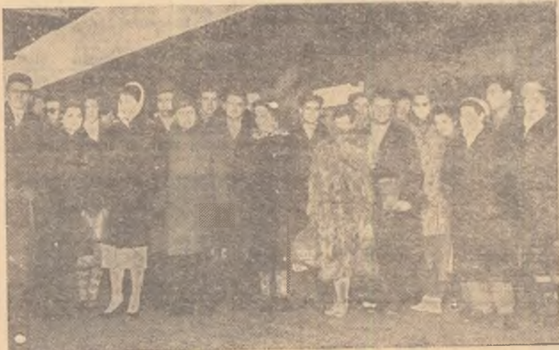
La cîteva minute de la sosire, o parte din concurenții străini fotografiați pe peronul Gării de Nord.

— „Competiția aceasta este mai dificilă decît cea de la Sofia. Participa