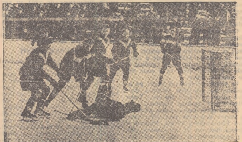
Un atac al Științei Cluj este oprit de portarul Recoltei, Sprencz 11