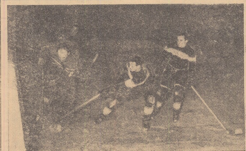
Una dintre cele mai disputate partide ale turului campionatului republican de hochei a fost aceea dintre echipele C. C. A. și Știința Cluj. Iată o imagine, din acest meci.