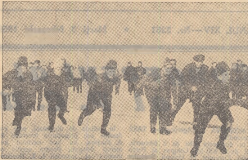
S-a dat startul! Patinatorii se avîntă pe oglinda gheții. Astfel de întreceri Spartachiadei de iarnă a tineretului

Fără îndoială că înființarea gospodăriei colective este în momentul de față preocuparea de capetenie a sătenilor din comuna Lehliu. Cu toate acestea, țărani de aci își găsesc timp să participe în după-amiezile și serile lungi