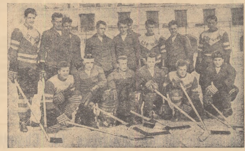
In cursul zilei de ieri echipele participante la turneul internațional au făcut ultimele antrenamente. În fotografia noastră puteți vedea tîndra formație A.S.K. Vorwärts din Berlin cu cîteva clipe înainte de a începe antrenamentul

La ora cînd poate o parte din cititorii noștri răsfoiesc paginile ziarului, căutînd ultimele știri în legătură cu turneul internațional de hochei pe gheață dotat cu „Cupa București”, pe patinoarul artificial din parcul „23 August” arbitrii au și fluierat începutul primei partide... Aceasta însă nu ne scutește să prezentăm totuși o serie de amănunte legate de acest important eveniment sportiv.