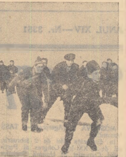
S-a dat startul! Patinatorii se avîntă pe oglinda gheții. Astfel de întreceri Spartachiadei de iarnă a tineretului