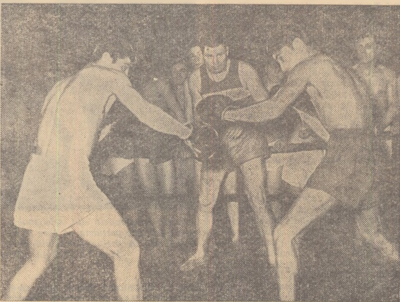
După terminarea orelor de producție, tinerii boxeri de la Grivița Roșie, sub atența supraveghere a antrenorului lor, se pregătesc cu asiduitate pentru a reprezenta cu cinste culorile asociației lor sportive

noiu, despre lipsurile îndurate de cei care pe atunci vroiau să facă sport. „Voi, băieți, aveți astăzi condiții minunate și aceasta datorită luptei clasei muncitoare, datorită luptei partidului. Nu uitați cui datorați toate acestea!”