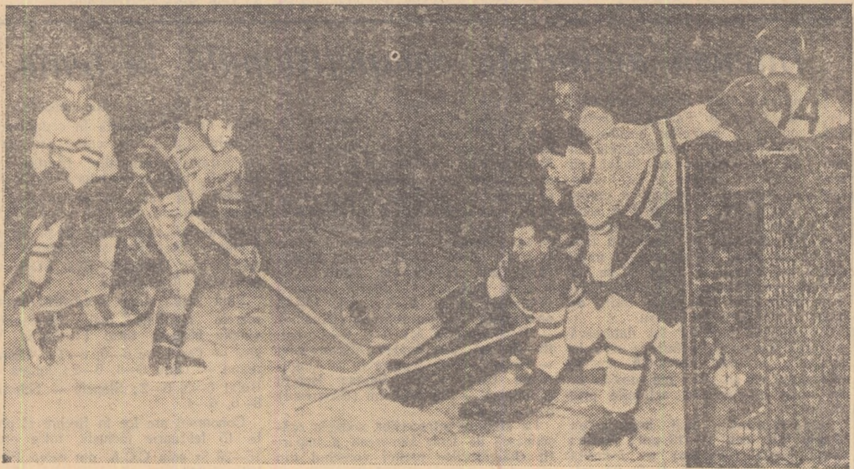
Atac la poarta echipei Budapestei. Jucătorul german Raczwick ratează o ocazie favorabilă de a marca.