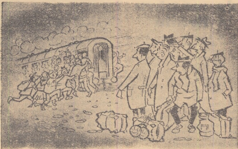
Echipa de handbal; — Ce-o să ne jucem, că au plecat supporterii fără noi?..

Intreprinderea Mătasea roșie din Cisnădie are o echipă de handbal în categoria B. Cînd se fac deplasări, șeful delegațiilor care vor să însoțească echipa este interminabil. Și nu poți lua pe unul și lăsa pe altul că — deh! — sînt atîția șefi mai mici sau mai mari... (După o corespondență trimisă de Constantin Crețu).