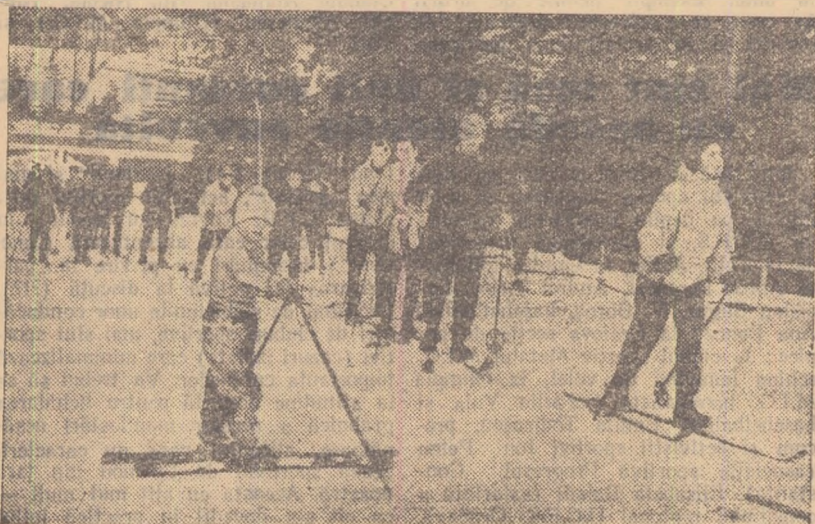
Și acum, din nou la drum!...