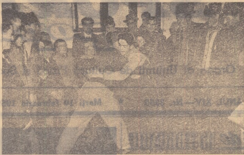
Cine-i mai puternic? Cu puțin timp înainte de a începe întrecerea, doi tineri din comuna Valea Dragului își încearcă puterea.

Nu trece o zi fără ca în mulțimea de scrisori care ne sosește la redacție să nu fie și citeva care ne aduc vești despre frumoasele rezultate obținute în munca asociațiilor sportive de la sate. Înființarea de noi secții pe ramură de sport, organizarea în număr din ce în ce mai mare a „Duminicilor sportive”, creșterea bazei materiale prin amenajarea unor baze sportive simple și prin procurarea de material și echipament sportiv, precum și succesul de care se bucură competițiile de masă sunt noi mărturii ale continuei dezvoltări pe care o înregistrează sportul în satele patriei noastre. Cele citeva vești pe care le publicăm mai jos sunt și ele mărturii ale acestei rodnice activități, ale creșterii și întăririi muncii sportive din cadrul asociațiilor sătești.