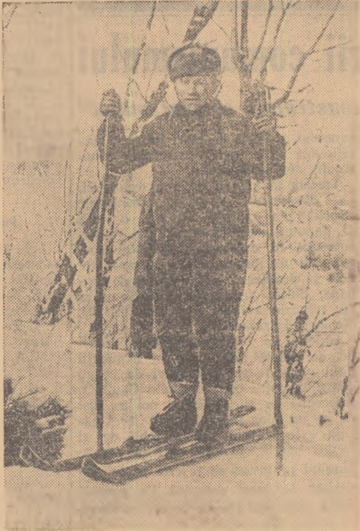
Gata de... start, unul din primii elevi ai școlii viticole, nu pare totuși supărat că l-am reținut o clipă pentru o... fotografie

gresul”, Școala agricolă Voiești, „Unirea”, Dejești și altele au fost furnizate peste 1.000 de noi carnete de membru al U.C.F.S. și că fiecare adunare a însemnat o adevărată sărbătoare pentru tinerii sportivi. Tot în acest timp, la Călina, Ștefănești, Strejeștii de sus și în școlile din orașul Drăgășani, sute de tineri au devenit membri ai U.C.F.S., iar cotizațiile au fost încasate în proporție de peste 70 la sută. Notezi cu bucurie și faptul că în această iarnă activitatea consiliilor