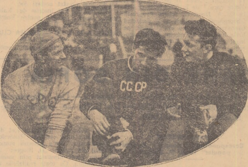
Trei dintre cei mai buni sulițași europeni: suedezul Frederiksson, sovieticul Kuznefov și polonezul Sidlo

tateilor sale a fost: 53,09 m în 1949 (la 16 ani. În acest an a debutat ca internațional în cadrul meciului Polonia—România); 58,76 m în 1950; 67,88 m în 1951; 68,42 m în 1952; 80,15 m în 1953; 79,03 m în 1954; 80,09 m în 1955; 83,66 m în 1956; 82,98 m în 1957 și 81,97 m în 1958.