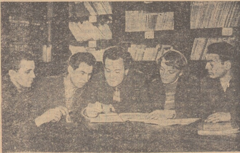
„Eroi” reportajului nostru studiază, la Cabinetul Tehnic al uzinei, revistă tratînd una din problemele care îi frămîntă pe ei în lupta pentru economie.