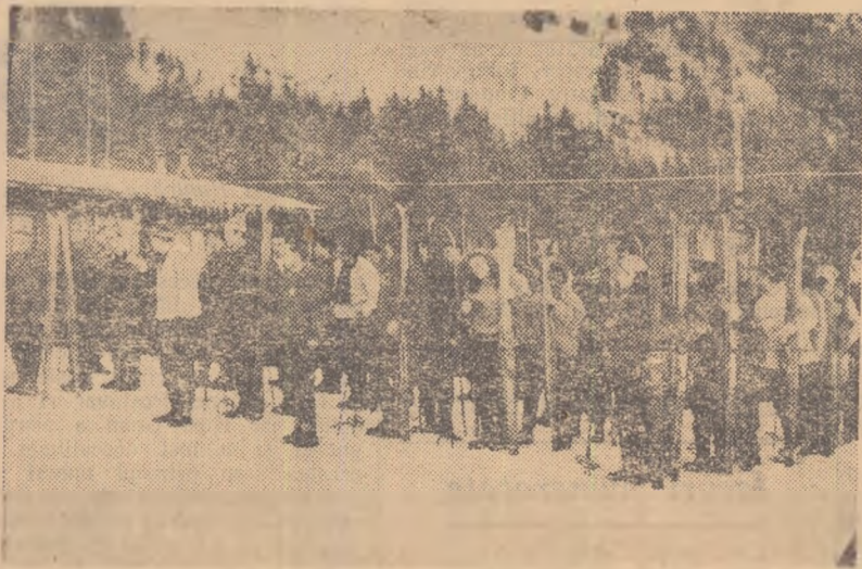
In vacanța de iarnă, cei mai buni sportivi — în același timp și studenți fruntași la învățătură — de la Institutul Medico-Farmaceutic, au participat la o kabară organizată în frumoasa stațiune de iarnă Poiana Stăniș, organizată cu sprijinul rectoratului, al organizației P.M.R. și al comitetului sindical I.M.F., a constituit pentru cei 60 de studenți și studente un felicit prilej de recreare și, în același timp, de antrenament în vederea viitoarelor competiții sportive.

Pentru realizările deosebite în dezvoltarea sportului în rândurile studenților, merită a fi evidențiate asociațiile de la Universitatea V. Babeș, Universitatea Bolyai și I.M.F. Cluj, Institutul Politehnic Orașul Stalin și Institutul Politehnic Timișoara. Insti-