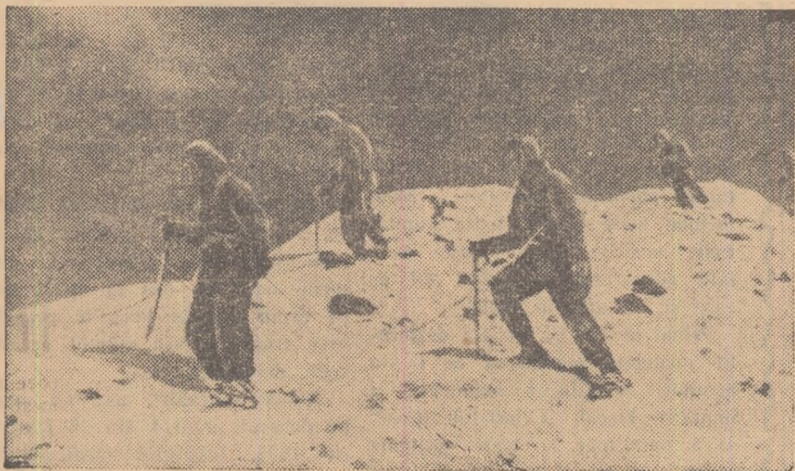
O traversare de iarnă

● A XII-a ediție a „Cursei Păcii” se încheie la 16 mai, la Varșovia.