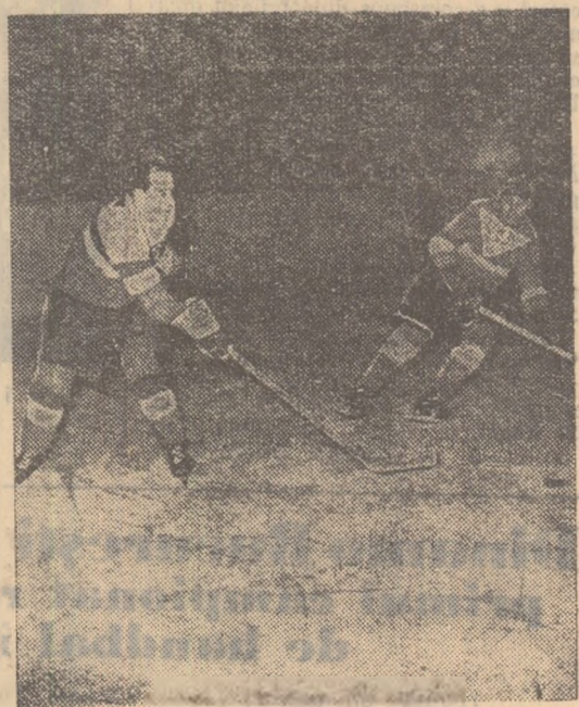
Fază din jocul Voința — Legia

Primele minute ale jocului au aparținut echipei C.C.A. care deși a dominat a ratat o serie de ocazii favorabile (Lörincz, Takacs, Biro, Nagy, Măzgăreanu). La un atac polonez apărarea echipei noastre se blîndește și