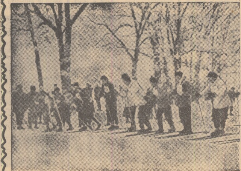
În minunatul decor al iernii, zeci de tineri și tinere din raionul Tg. Mureș au luat startul în cadrul etapei raionale a Spartachiadei de iarnă.