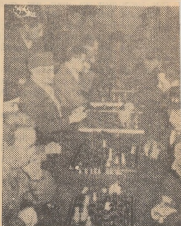
La S.M.T. „Rapid” Sf. Gheorgh șahul este un sport foarte îndrăglat o imagine de la un concurs ganizat recent.