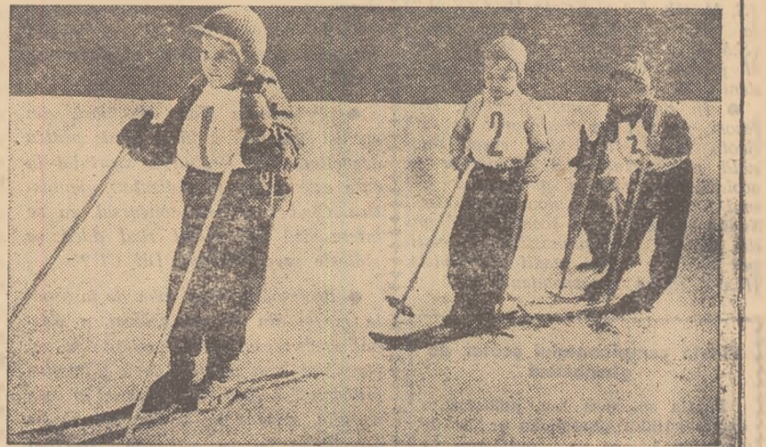
Start în proba celor mai mici schiori!

„Cupa 8 Martie” a fost cucerită de echipa Institutului Proiect București care a totalizat 7 puncte. Pe locurile următoare: Centrocoop, Proiectantul și Gloria. „Cupa Drumarilor” a re-venit asociației sportive Institutul Proiect București, urmată de Gloria și de Grivița Roșie.