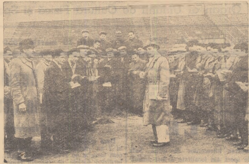
Explicații practice pe teren. Participanții la cursul organizat pentru amenajarea de terenuri sportive notează cu atenție cuvintele lectorului

activitate mai îndelungată au împărtășit din experiența lor celorlalți, care pînă acum nu au avut posibilitatea să pătrundă profund „tainele” meseriei. Majoritatea cursanților se bazează nu