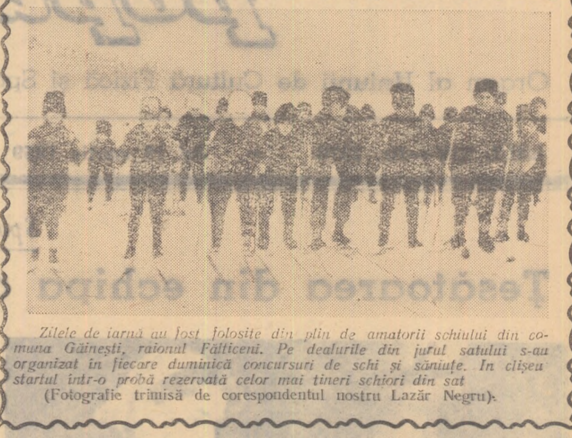
Zilele de iarnă au fost folosite din plin de amatorii schiului din comuna Găinești, raionul Fălticeni. Pe dealurile din jurul satului s-au organizat în fiecare duminică concursuri de schi și săniuțe. În clipa startului într-o probă rezervată celor mai tineri schiori din sat (Fotografie trimisă de corespondentul nostru Lazăr Negru).

ALEXANDRU MOMETE SIMION KEZDI-corespondenți