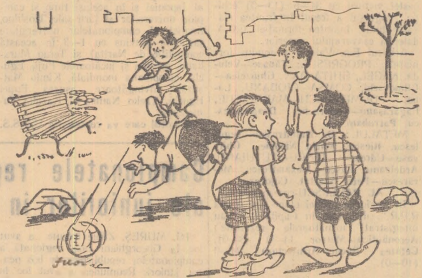
— Nelu asta n-o să ajungă niciodată jucător de categoria A. Nu vezi? Nu e în stare să... rateze o lovitură de 11 metri!

● Iată cîteva rezultate din prima etapă a campionatului categoriei secundă: C.F.R. Cluj — Chimica Tirnăveni 12-8 (6-5); Locomotiva Buzău — Petrolul Buc. 5-3 (5-0); Progresul Galați — Unirea Brăila 0-3 (0-3); A.S.A. Sibiu — Minerul Lupeni 6-0 (3-0).