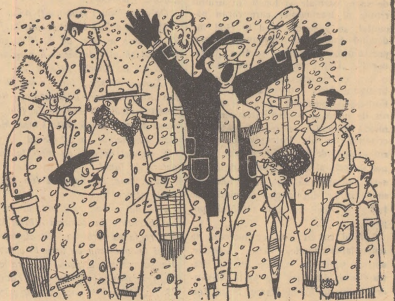
SCANDALAGIUL: Timpul, arbitrul Huot Timpull! Oprește zăpada!!!

Cu toată vremea nefavorabilă, meciurile din etapa I s-au desfășurat, în general, la un nivel satisfăcător.