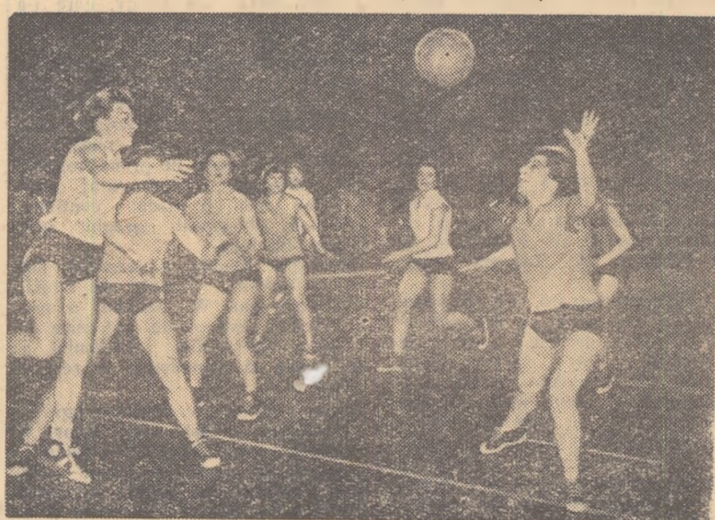
A cui va fi mingea? E greu de prevăzut, deoarece 8 din cele 10 jucătoare de la Progresul și C.G.A. o urmăresc cu încordare.