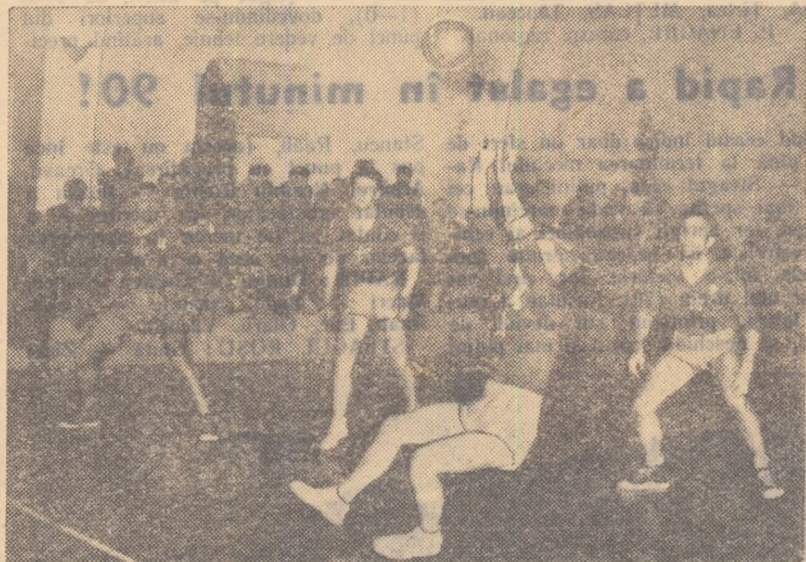
Fază din meciul Rapid — C.C.A. (3-1) disputat ieri în sala Gluștești.