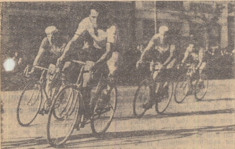
Aspect din desfășurarea cursei care a avut loc la Cluj cu participarea cicliștilor romîni și din R. D. Germană.

Revista ilustrată „Sport” acordă o cupă primului clasat