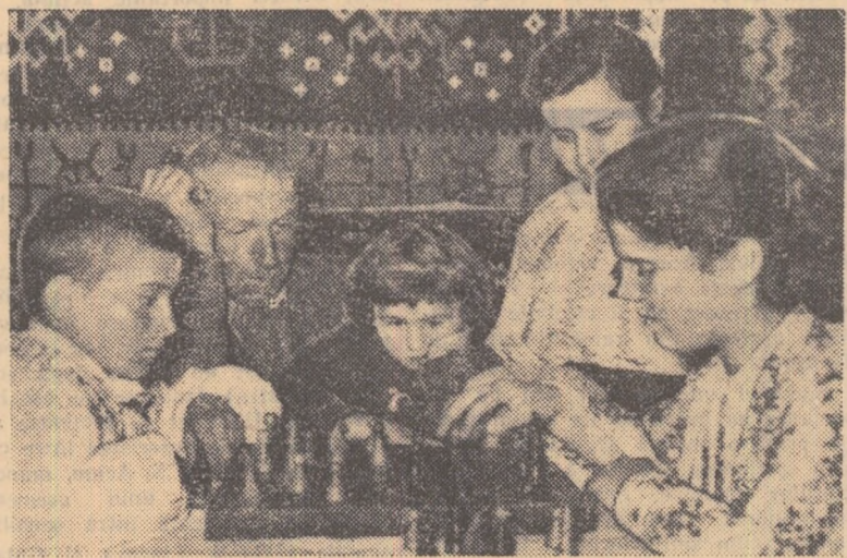
O pasionantă partidă de șah, urmărită cu același interes de vîrstnici ca și de copii, jucată în satul Bira din raionul Roman.

(articol trimis în cadrul concursului „Pentru cea mai bună corespondență”)