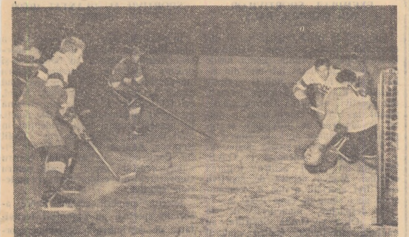
Amatorii de hochei pe gheață din Capitală vor putea urmări din nou dinamicele jocuri de hochei pe gheață cu ocazia turneului organizat de F.R.H.P. În fotografia noastră o fază de la ultimul joc disputat pe patinoarul din parcul „23 August”. Legia Varșovia — Selecționata București.

Programul va fi completat cu o serie de demonstrații de patinaj artistic, care vor fi făcute de cei mai buni patinatori și patinatoare din țara noastră.